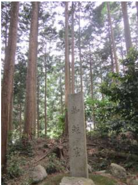
高天彦神社の近く 蜘蛛塚

奈良 葛城山 金剛山は かか（銅？）が出ると想うので、古くから金属の技術集団が、大陸から移住して住んでいたと想う。