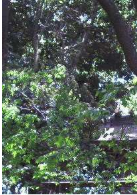
尾張一宮 真清田神社